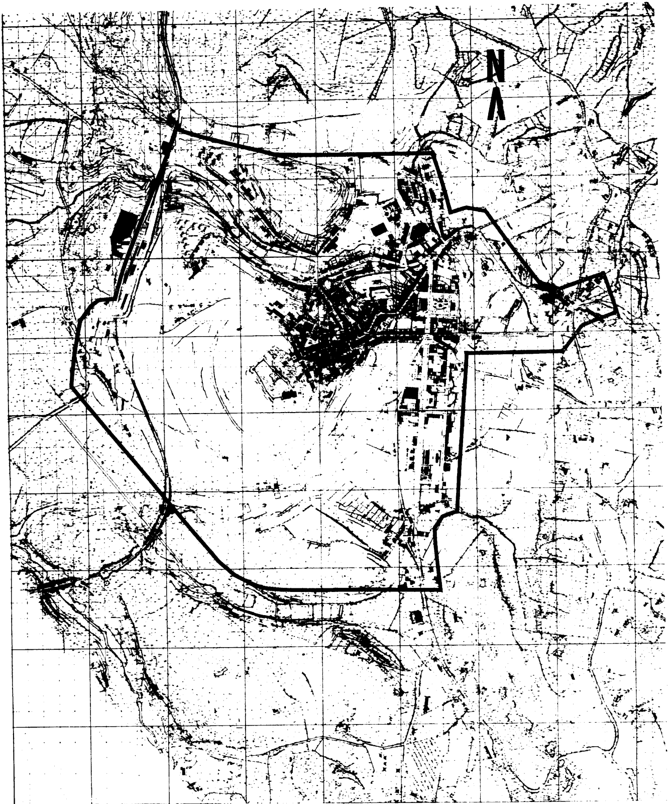
LIMITE DA ÁREA URBANA DE SANTIAGO DO CACÉM