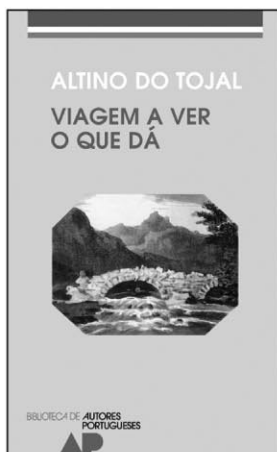
VIAGEM A VER O QUE DÁ