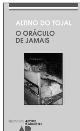
O ORÁCULO DE JAMAIS