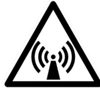
Símbolo ou pictograma