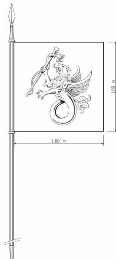
Figura B2 — Estandarte do Hospital das Forças Armadas — Traço