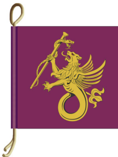
Figura D1 — Galhardete de Arvorar do Diretor do Hospital das Forças Armadas