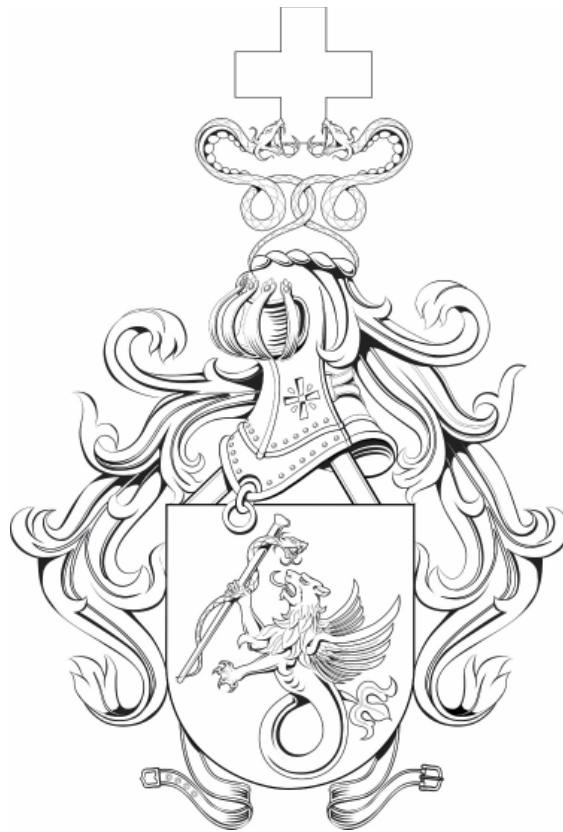
Figura C2 — Brasão de Armas do Diretor do Hospital das Forças Armadas — Traço