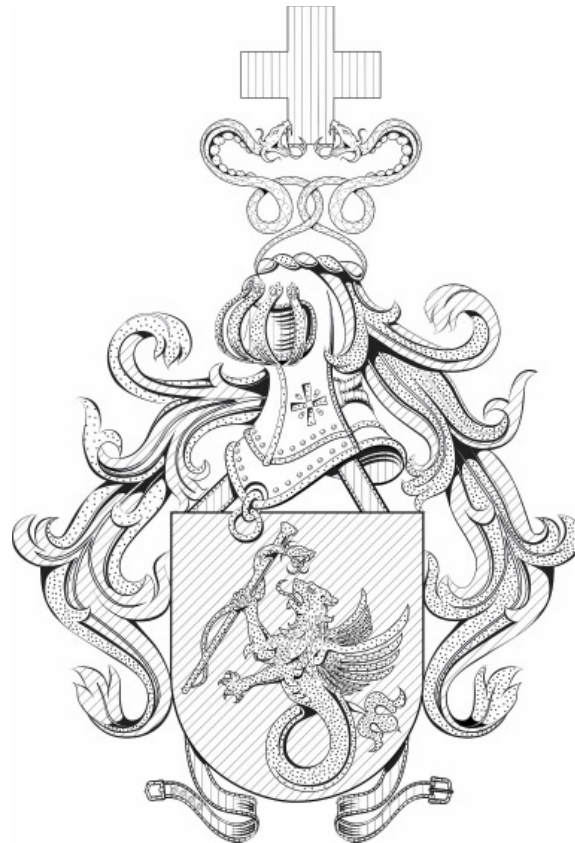
Figura C3 — Brasão de Armas do Diretor do Hospital das Forças Armadas — Pietra Santa