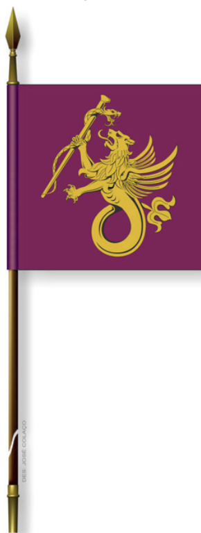
Figura B1 — Estandarte do Hospital das Forças Armadas