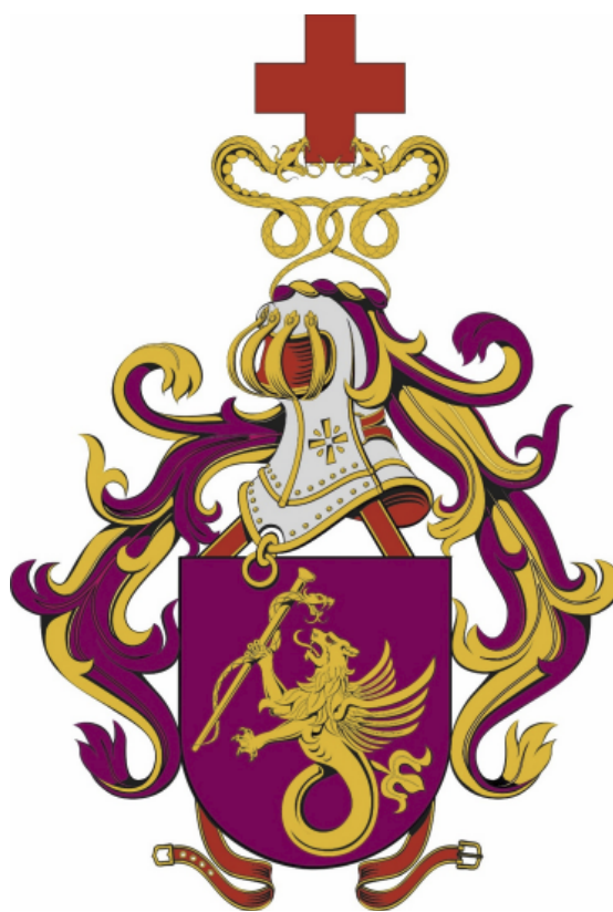
Figura C1 — Brasão de Armas do Diretor do Hospital das Forças Armadas