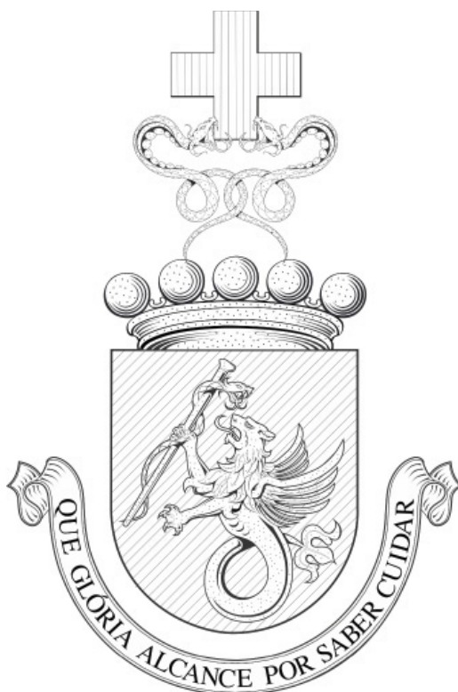
Figura A3 — Brasão de Armas do Hospital das Forças Armadas — Pietra Santa