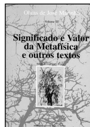
SIGNIFICADO E VALOR DA METAFÍSICA E OUTROS TEXTOS