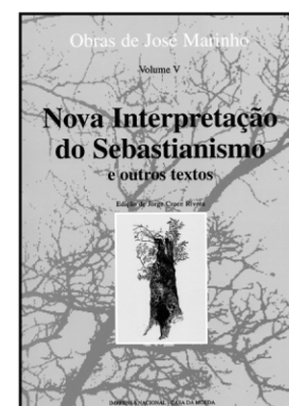
NOVA INTERPRETAÇÃO DO SEBASTIANISMO E OUTROS TEXTOS