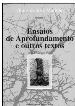
ENSAIOS DE APROFUNDAMENTO E OUTROS TEXTOS