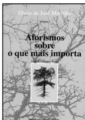
AFORISMOS SOBRE O QUE MAIS IMPORTA